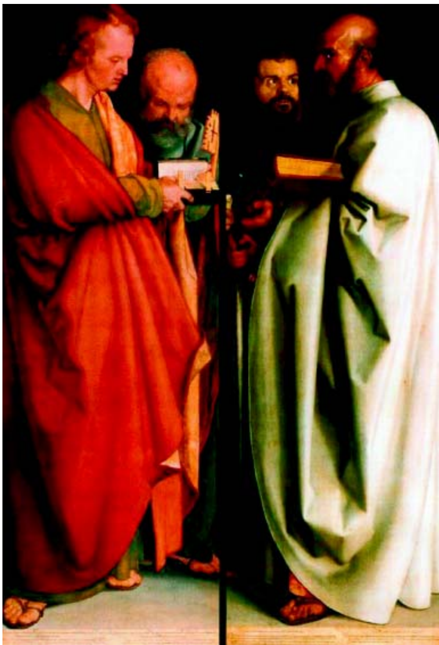
Los cuatro santos. Alberto Durero. Ite Pinakothek. Munich. Alemania.

C.S. Lewis observó hace unos años: "El cristianismo es una religión que uno no podría haberse imaginado" .