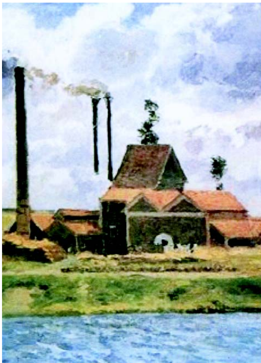
Fabbrica vicino a Pontoise. Camille Pissarro. Springfield Museum. USA.

En la política empresarial, por tanto, la clave está en que existan personas de negocio, profesionales de la gestión y dueños de la institución, figuras que unas veces aparecen entremezcladas y otras con una clara diferenciación.