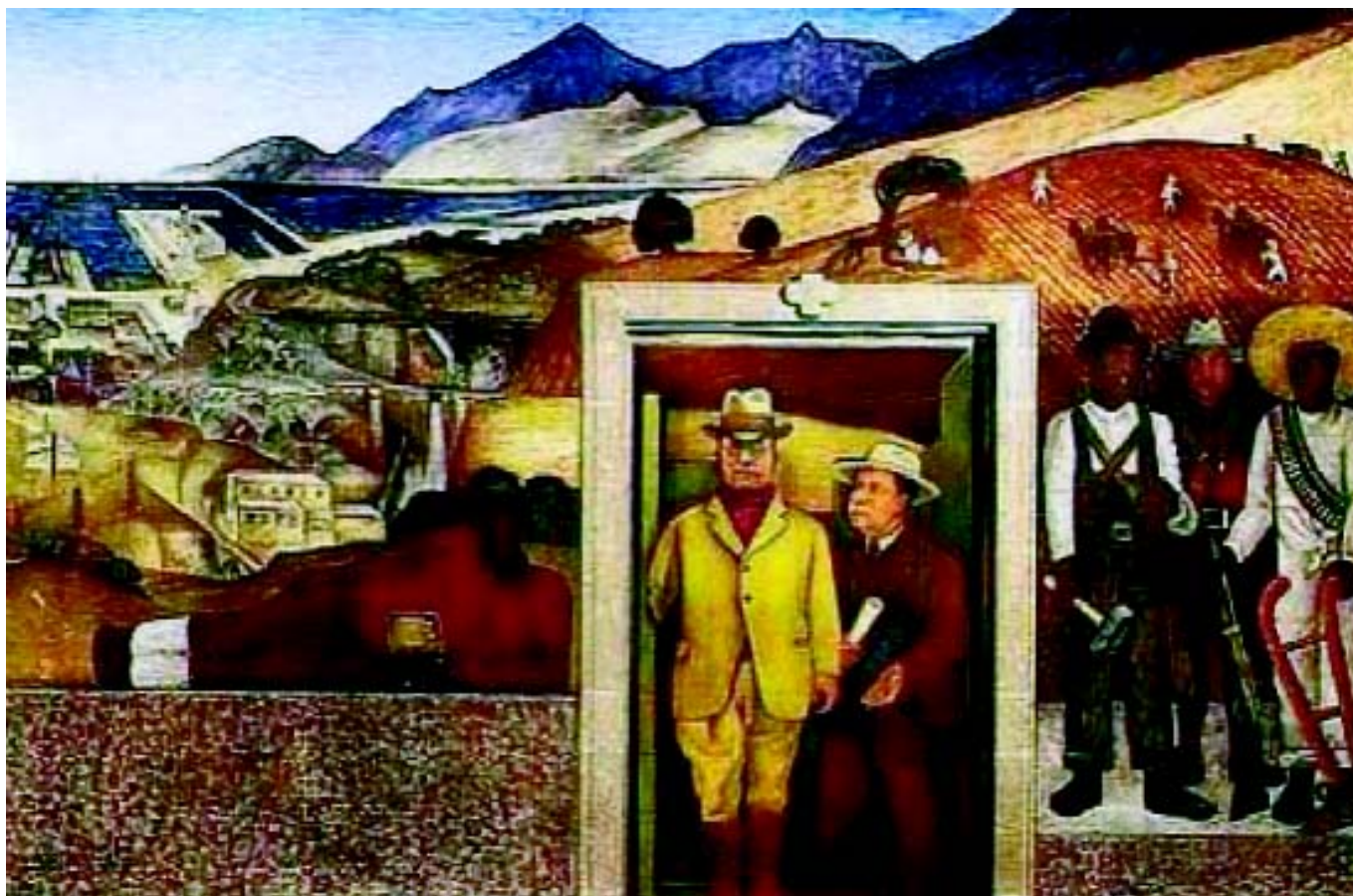
El Buen Gobierno. Diego Rivera. Universidad Autónoma de Chapingo. Administration Building. Chapingo. Mexico.

manencia de los gobiernos públicos sean trienales, con sólo una posible reelección; los medios actuales de información y comunicación permiten abordar los asuntos con prontitud y los ciudadanos perciben con mayor nitidez los objetivos planteados y los resultados conseguidos. Una segunda alternativa sería, en períodos cuatrienales de mandato, establecer una consulta popular al final del primer bienio sobre la continuidad del máximo responsable -en caso de que resultase negativa, no se efectuaría una campaña electoral, pero el partido en el poder sustituiría al responsable por otra persona de su confianza-.