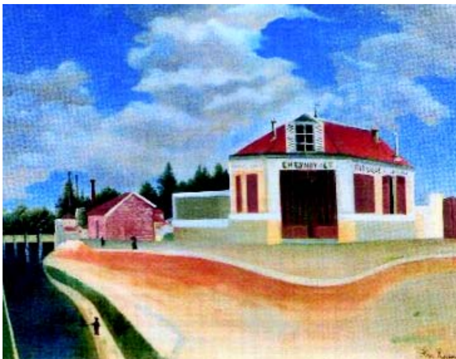
La fábrica de sillas. Henri Rousseau. Colección de Jean Walt.

La política pública, si quiere tener justificación, ha de volver los ojos hacia las necesidades de convivencia de los ciudadanos actuales y de los por venir (no sólo de los propios votantes); de ahí se deriva la conveniencia de identificar bien las organizaciones públicas, definir metas y recursos, comprometer públicamente a los equipos dirigentes y auditar los resultados y los medios empleados.