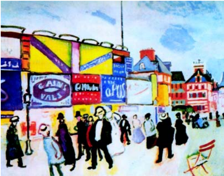
Carteles Publicitarios en Trouville. Raoul Dufy. Museo Nacional de Arte Moderno. Centre Georges Pompidou. París. Francia.

Las razones de esta nueva norma habría que buscarlas no tanto en la regulación del contenido del protocolo familiar (que no hace), sino en la protección de los derechos de terceros, en el fomento de la transparencia en la empresa familiar y en la garantía de las obligaciones pactadas, aspectos que se demandan por los distintos protagonistas (financiadores, inversores, propietarios, familiares y trabajadores). En definitiva, la norma, a nuestro juicio, pretende ayudar a transmitir una imagen de solvencia, estabilidad y garantía de la continuidad de la empresa 6 , que facilite la confianza de los operadores del mercado y, en consecuencia, la colaboración a largo plazo de éstos con la empresa familiar. Y ello, sin que