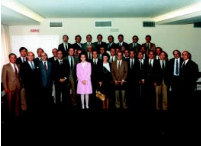
La Fundadora y el Presidente del Insitituto, junto a la primera promoción del programa AD-I en Sevilla.